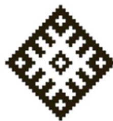
Союз солнца и земли. Символ урожая