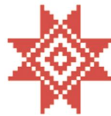
Символ ребёнка. Оберер