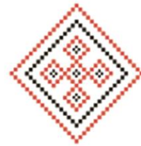
Символ крепкой семьи