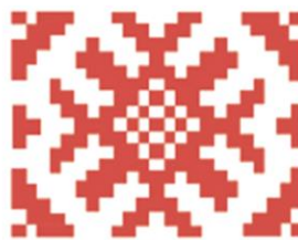
Символ весны и молодости