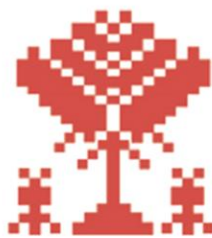
Дерево жизни, символизирует вечность