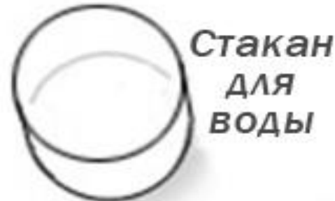
Стакан для воды