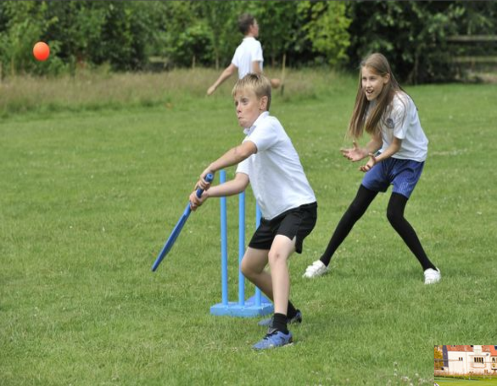
Занятие по крикету