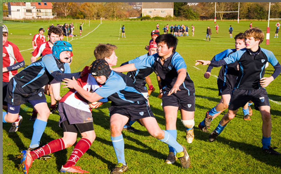
Соревнования по регби