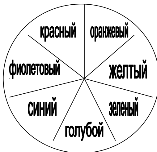
Цветовой круг Ньютона.

Немецкий поэт И. В. Гете в XVIII – нач. XIX вв., разложив напротив основные контрастные цвета, Гете построил 6-ступенчатый цветовой круг; также предложил треугольник в качестве спектральной системы.