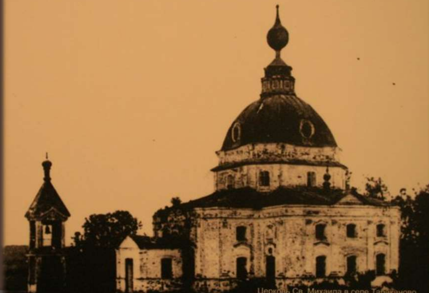
Церковь Св. Михаила в селе Тараканово, где 17 августа 1903 года обвенчались А. А. Блок и Л. Д. Менделеева