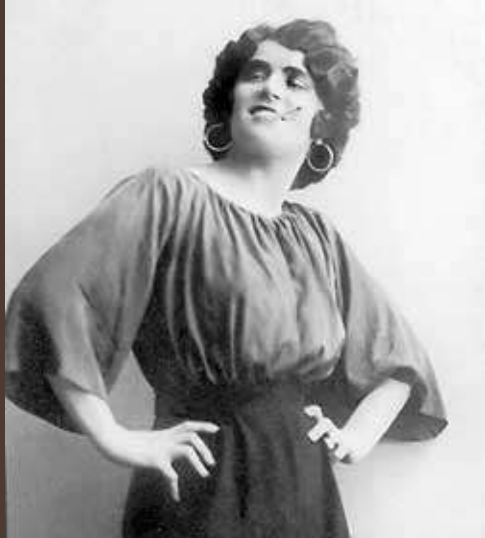
Любовь Александровна Дельмас (урожденная Тишинская) в роли Кармен.