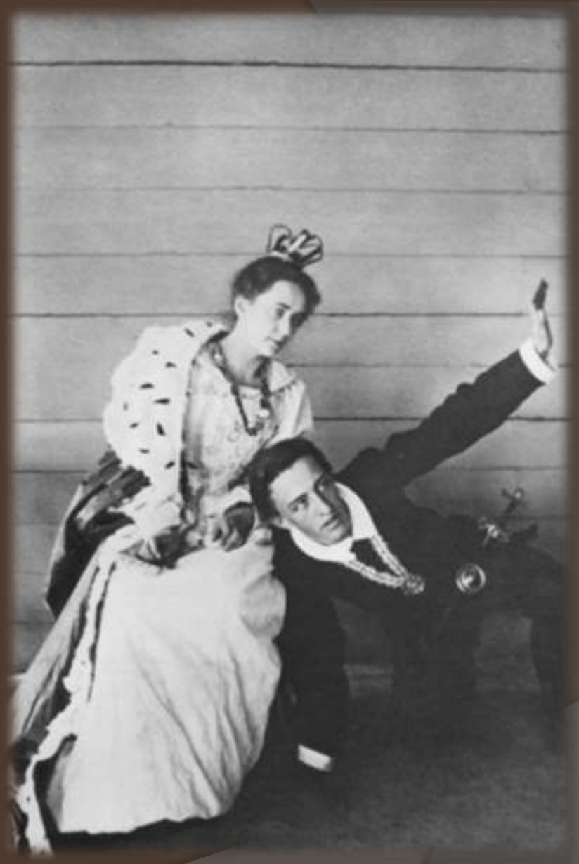
Домашний театр. Гамлет

Зима 1897г. Блок мечтает стать актером, он увлечен игрой В. П. Далматова и М. А. Дальского, занимается декламацией и мелодекламацией, участвует в любительских спектаклях. Изучает роль Ромео. Декламирует стихи А. А. Фета, А. К. Толстого, Я. П. Полонского, А. Н. Апухтина.